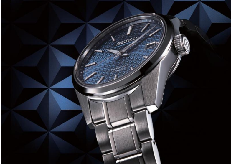
Düz yüzeyler, keskin tanımlı açıları oluşturuyor.

Seiko Presage Sharp Edged Serisinin kasa ve bileziğindeki düz yüzeyler, saatin her açıdan parlamasını ve ışıldamasını sağlayan modern bir keskinliğe sahip. Yeni serideki dört saatten üçü, kasayı ve bileziği çizilmelere karşı koruyan ve aynı zamanda ona uzun ömürlü bir parlaklık kazandıran süper sert bir kaplamaya sahip. Kusursuz bir şekilde tasarlanmış ve cilalanmış yüzeyler ve silüetinin keskin kenarları, çok boyutlu bir etki yaratmak için mat finisajlı yüzeylerle tezat oluşturuyor.