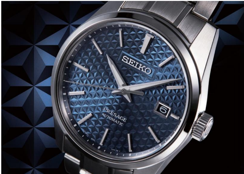
Kadrını, karmaşık bir Asanoha deseni süslüyor.